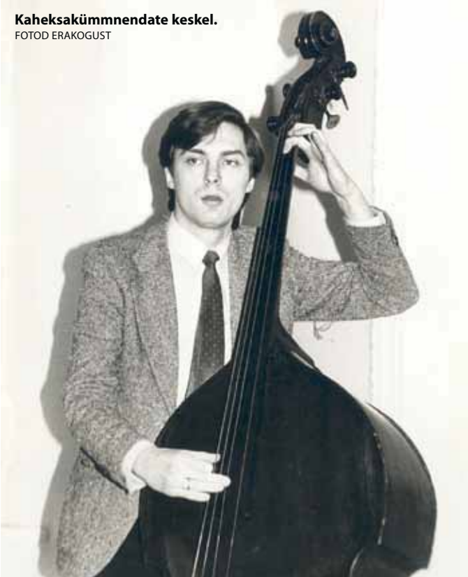
Kaheksakümnendate keskel. FOTOD ERAKOGUST