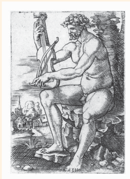
Esisa Aadam gambaga 16. sajandi tundmatu saksa meistri gravüüriil (Briti Muuseum, London).

Kui viuliperekond põlvneb keskaegsest õlal mängitavast keelpillist, tingliku nimetusega fidel , siis gamba juured on hoopis Hispaanias. Nii mõnegi ühise tunnuse põhjal – soolest seotud krihvid, sile tagumine