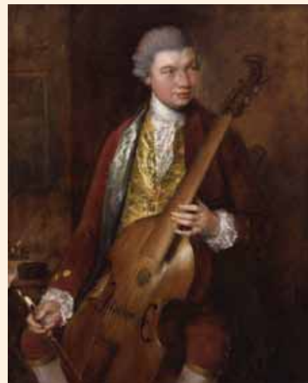
Viimane kuulus gambist – Saksa helilooja Karl Friedrich Abel (1723–1787) Thomas Gainsborough maalil (National Portrait Gallery, London).

Gamba kaob kasutusest 18. sajandi keskel, sest valitsev kõlaideaal hindas rohkem viuliperekonna selget ja tugevat häält, mis oli tähtsaks revolutsiooni vägevate ideede kandjana ja kunstniku-virtuoosi isiklike tunduste peegeldajana sobilikum. Gamba aristokraatne, tundlik ja varjundirikas kõlamaailm vajus varjusurma kuni taasärkamiseni 20. sajandi alguses.