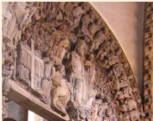
24 apokalüptilist vanemat mängimas erinevaid keelpille Santiago de Compostela katedraali auvärvate kaarel.