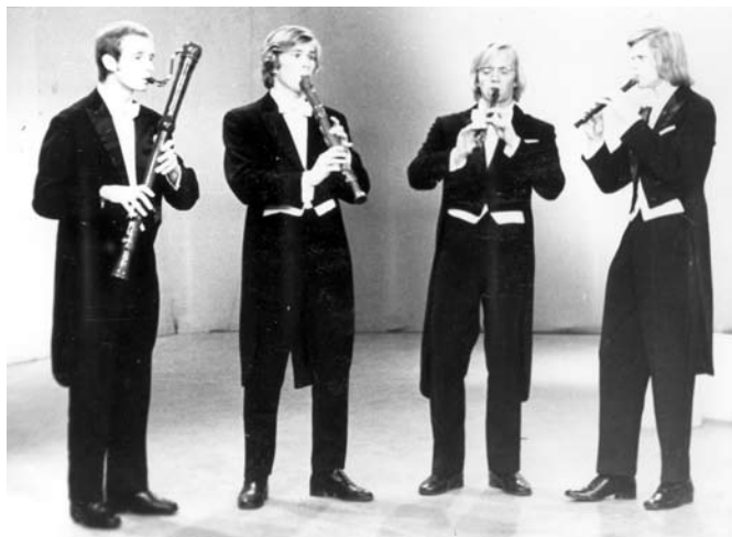
Hortus Musicuse esimene ülesastumine Eesti Televisioonis 1973. aastal. Kintspüksid tulid hiljem.

Nojah, nagu kunagi keegi ütles, et hoidku Jumal mind heade aegade eest, kurjade ja halbade ma saan ise hakkama. Kui vaada-