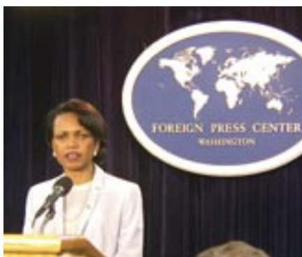
USA riigisekretärist Condoleezza Rice'ist oleks võinud saada ka pianist.