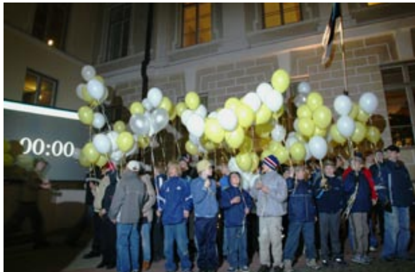
Poistekoor Kalev Stenbocki maja õuel, tähistamas Eesti ühinemist Euroopa Liiduga.