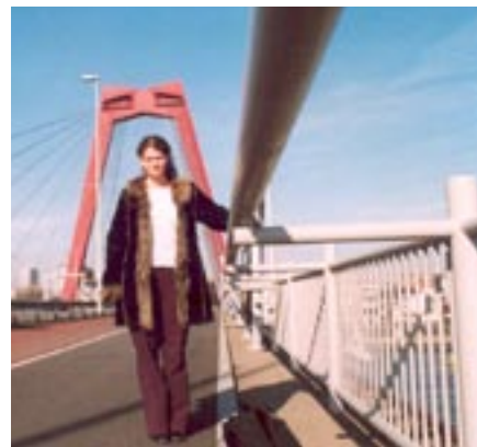
Malle Rotterdami Punasel Sillal, 2003.

Fonogrammi komponeerimiseks salvestasin sõprade kaasabil kõikvõimalikke klaasjaid ja metalseid helisid tekitavaid objekte Muusikaakadeemias, näiteks metallkäsipuid, jalgrattaid, fuajees seisvat katkist pronksskulptuuri, alumiiniumist prügikasti, lauajalgu jms; me lõhkusime ära kaks klaasi ja salvestasime kildude helisid. Pidime seda