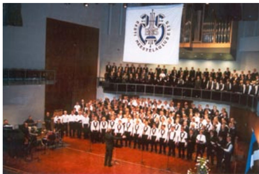
Meestevägi Pärnu kontserdimaja laval.